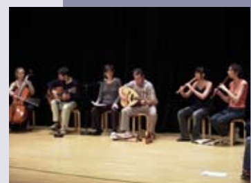
Summer Academy 2007