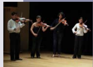
Summer Academy 2007