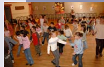
Artists in Residence 2006